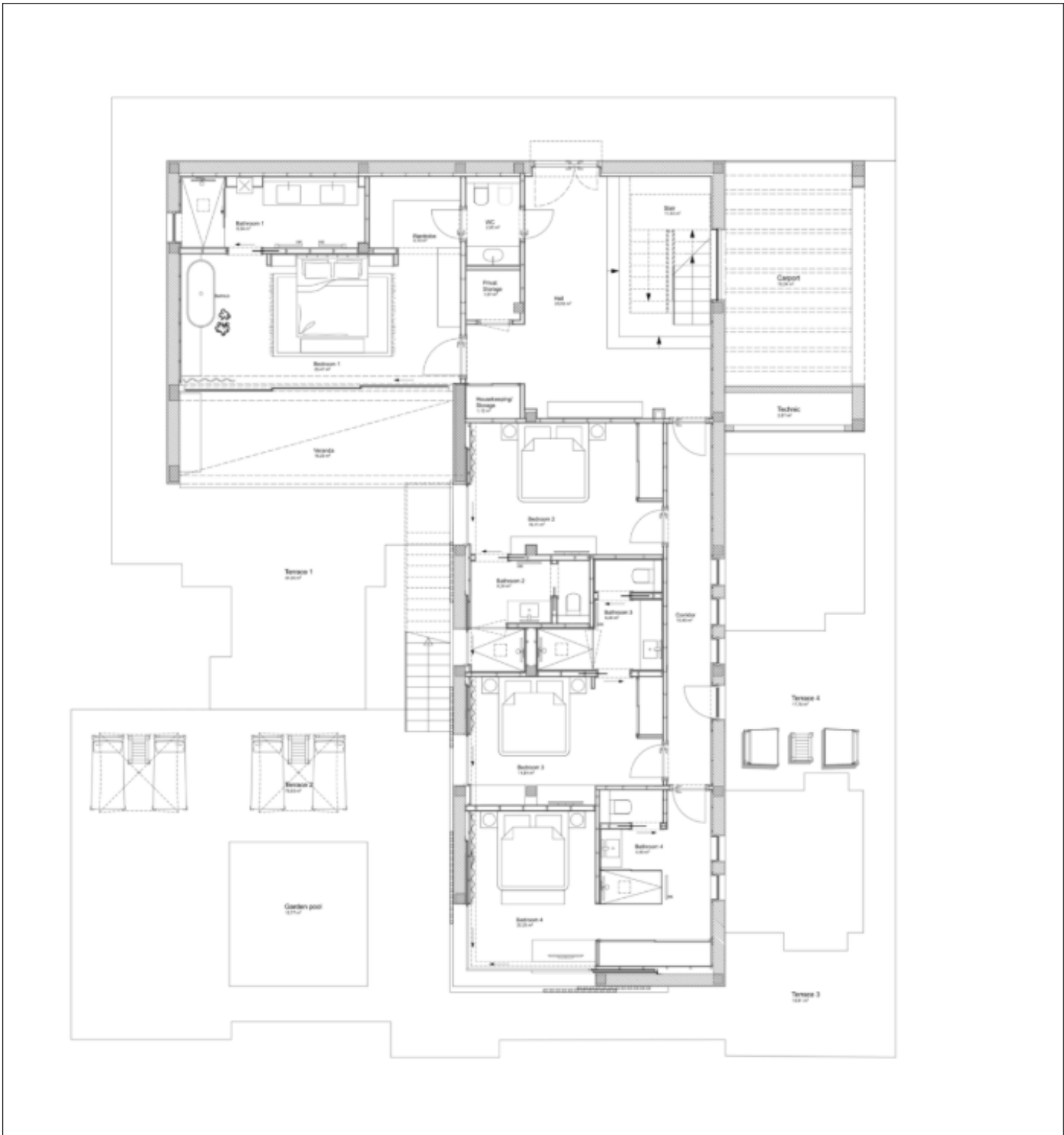
Plano de planta